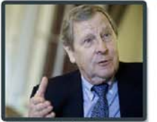
Händlerische Rasiermaschine: Ausgehwer (oben) und Neuhans (unten)

Das Listing selbst muss nicht ausgedruckt werden. Vor Ort leistet es nicht wirklich brauchbare Dienste.